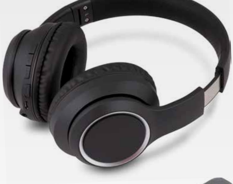
SEP 710BT BK