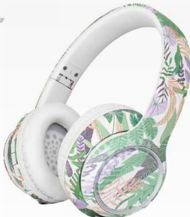
SEP 710BT GR